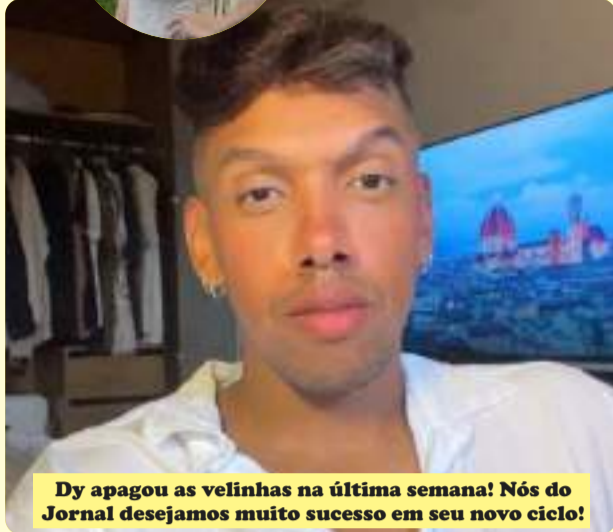
Dy apagou as velinhas na última semana! Nós do Jornal desejamos muito sucesso em seu novo ciclo!